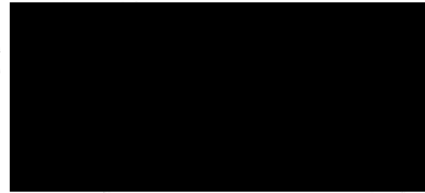
SUPERINTEDETE DE CONSTRUCCIÓN GRUPO CONSTRUCTOR INTELLIGENT MAVICMEX, S.A. DE C.V.